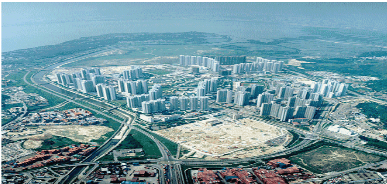
攝於 1997 年發展中景象

在制定本堂的方向時，我們教會事奉工作策略是務要把「未得之民」( unchurched or Strangers ) 轉化為「教會會友」( Church Members )，這是一個生命成長的進程( From unchurched or Strangers to Believers & from Believers to Church Members )。由一個人從「未得之民」轉化為「慕道朋友」( Visitors )，由「慕道朋友」( Visitors ) 轉化為「得救信徒」( Believers or converts )，由「得救信徒」轉化為「教會會友」( Church Members )，就是這個進程。為此，我們便致力去栽培這群「得救信徒」而使他們能有一天可轉化為「加入教會的信徒」( Church members )，成為天恩堂肢體的一份子。我們最終的盼望是教會中各肢體成為「教會會友」( Church Members ) 後會對天恩堂產生一份歸屬感，進而成為教會的中堅份子( Core Member )，再不以一個過客身份來參加聚會。此外我們也要訂定教會的未來牧養目標： 1. 使「敬拜」令到人心得著激勵、 2. 使「教導」能建立主肢體的生命、 3. 使「相交」能促進肢體的連合、 4. 使「佈道」能使未得之民回轉歸向上帝及 5. 使「門訓」能建立更多基督精兵。