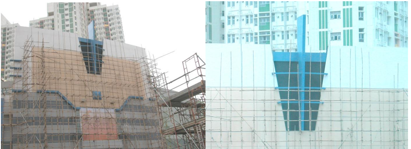
圖片顯示：天恩區的幼兒園所處的「天恩商場」外牆中央出聳立了一個類似十字架標誌的物體。

堂會發展至今，我們已有 110 多位成人肢體到來聚會，若連青少年及兒童的會眾人數計算在內，到來主日聚會已達至約 160 多人；另再上一些不能返主日崇拜而又有追求真理的街坊朋友，本堂所牧養的人數已超過 200 多人。由於我們繼續不斷地進行個人佈道的工作，因此信主的人數亦不斷上升，以致我們目前的地方已呈現水洩不通的現象。有鑒於此，我們正密切開拓新福音據點的機會。目前，本堂的牧養工作已漸受天水圍街坊認識及接受，我們見到弟兄姊妹願意被興起來事奉主外，我們也見到教會中得救及初信主的人數不斷增加；在崇拜地方方面，除見到神為我們預備了青年會幼稚園一個寬敞的敬拜地方外；在不久將來，當天恩區幼兒園落成後，本堂更可有另一處地方聚會，料教會人數會不斷增長。現今我們看到天恩區的幼兒園所處的商場已命名為「天恩商場」，當中有一個現象使我們感到非常驚訝的，事因該商場的外牆中央，竟然聳立了一個類似十字架標誌的物體。當我們看到這類似十字架標誌的物體時，便隨即向上帝獻上讚美的呼聲：「哈利路亞！」我們在此體會到上帝要在水圍天恩區彰顯祂的救恩；我們真的盼望天恩區的每一位居民仰望這十字架時，他們就能得著救恩及醫治。當我們經歷到上帝不斷從天上降下豐沛的恩典時，我們也不為眼前的困境而沮喪及退縮，反而願意天天背負自己的十字架，緊緊靠著主向前行，實踐祂的使命。