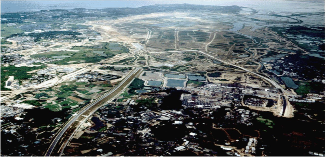
天水圍發展前的景象