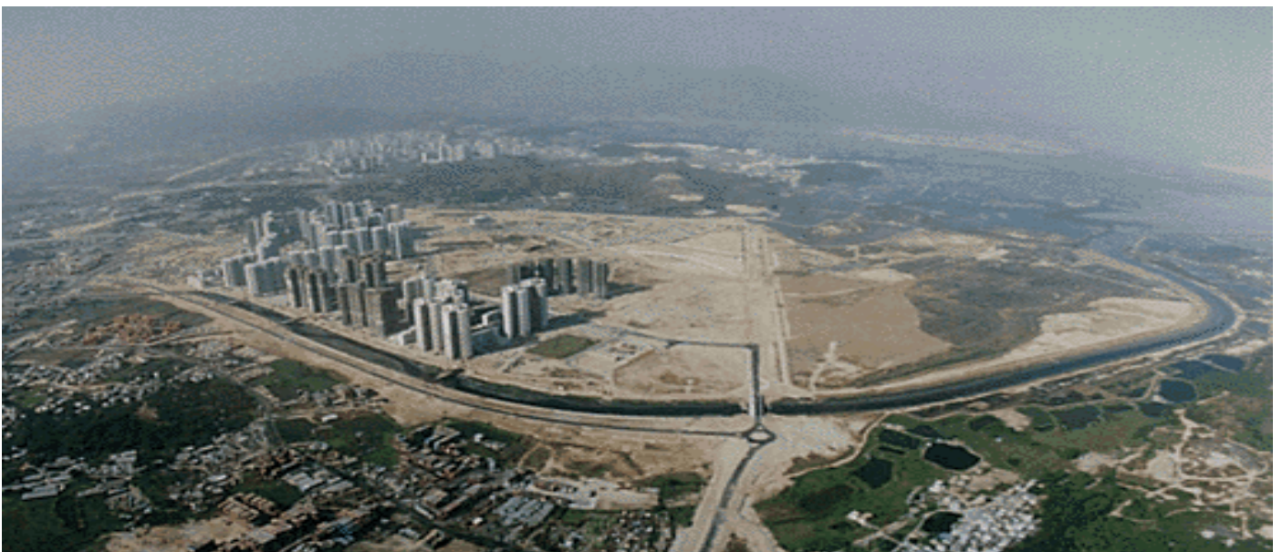
攝於 1992 年發展初期景象

教會增長專家 馬蓋文 (Donald McGavran) 曾指出：「在 20 世紀最後的十多年，教會除繼續宣揚福音外，還需靠神的恩典，在還未有教會設立的地方——可能是城市、發展中地區、某社會階層、部落、山谷、平原、或少數民族中建立一群一群增長的會眾。」從以上的說話之領受，教會植堂在現今時代的趨勢是無可置疑的事，也是責無旁貸的使命。《以賽亞書》54：2-3 提醒我們：「 要擴張你帳幕之地，張大你居所的幔子，不要限止，要放長你的繩子，堅固你的橛子；因為你要向左向右開展，你的後裔必得多國為業，又使荒涼的城邑有人居住。 」